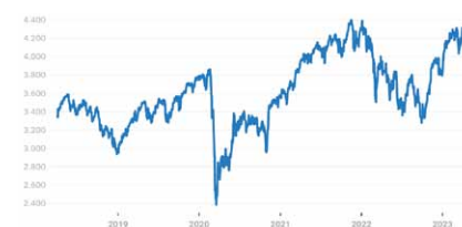
Euro Stoxx 50