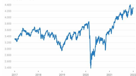
Euro Stoxx 50